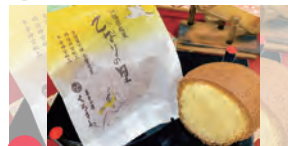
04 菓子工房くろさわ