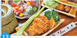
13 とんかつ割烹 松村