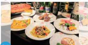
04 イタリアン ガーデン