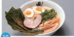
19 麺屋 鼎