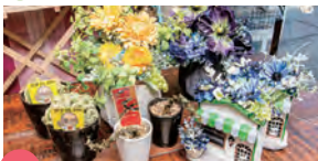
02 アバンギャルド花木秀