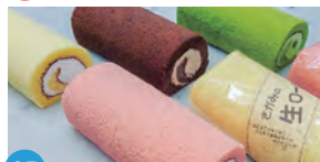
05 お菓子工房 あん・プティ・ふる〜る