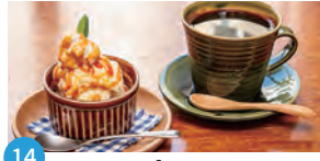
14 naruco cafe