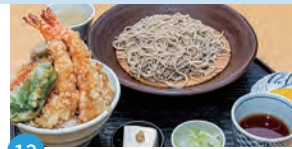
12 十割そば家 みつば