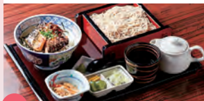
11 手打蕎麦 加寿屋