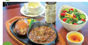
09 レストラン栗の里 二本松店