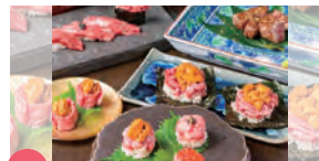
14 肉割烹 英