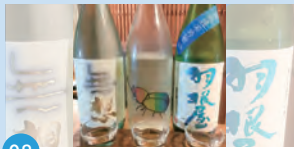
08 旬鮮酒場 NOBU