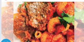
03 イタリア食堂 Fagotto