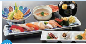
10 すし魚菜 かつまさ