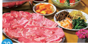
20 焼肉 八起