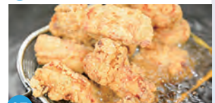
07 からあげ専門店 すごいっ手羽