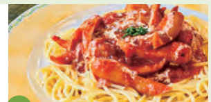
05 スパゲティ屋 青山