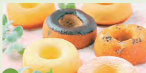
01 アンファンージュ