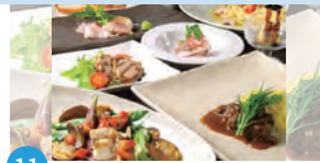
11 善吉 醸し屋