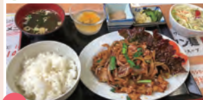
01 あつあつ中華工房 秀栄