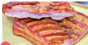
12 手造りハム・ソーセージ クライフ