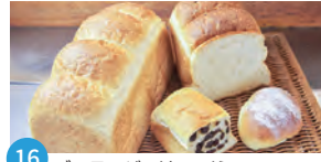
16 プーランジュリ アイミ