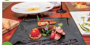
08 Bistro Masa Kiwami