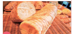
15 パンド クルー