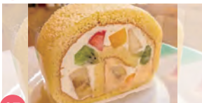
07 セ・ラ・セゾン! 相模原本店