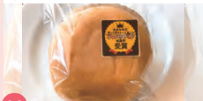
06 カフェ トガン