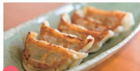
13 とことん餃子の朝日屋