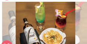
18 Lovers ROCK 相模原本店