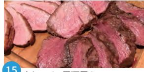
15 肉とワイン居酒屋Acorn