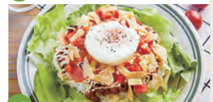
10 1Life Cafe